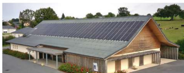
Toiture photovoltaïque sur la salle des fêtes de Gramond (12)